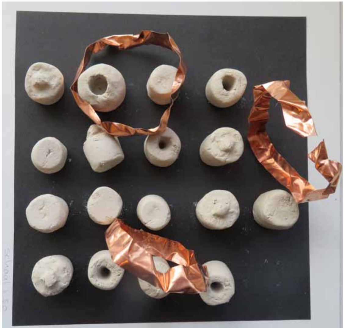
MODELSTUDIE - BOVENAANZICHT