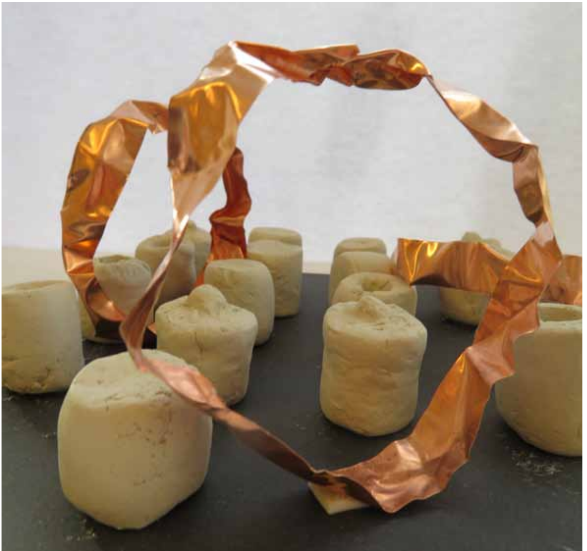
MODELSTUDIE - ZIJAANZICHT