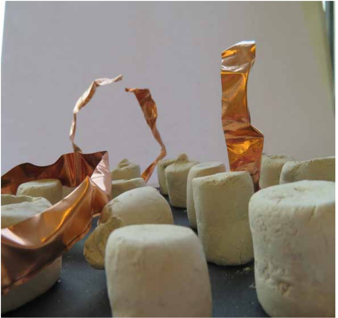
MODELSTUDIE - ZIJNAANZICHT